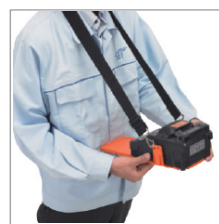
Stół roboczy WT-15