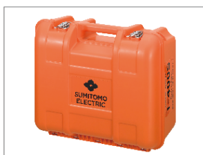
Walizka transportowa CC-15