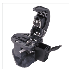
Gilotyna stołowa FC-5S