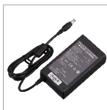
Adapter AC ADC-15